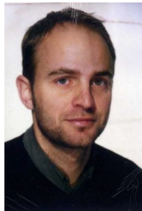
Stilling Bernhard Ultimate 20